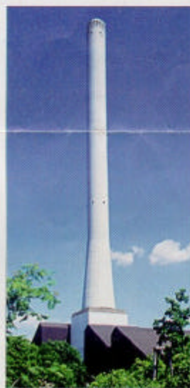
Heizwerk-Kamin: An den Contractor verpachtet

Der VfW betreute 1999 nur 10 Verträge zur Wärmelieferung durch Mitgliedsfirmen (1998: 5500) mit einem Gesamtenergiebedarf von 958 (1998: 5990 GWh). Dabei wurden durch Contracting 2396 GWh (1998: 1497 GWh) Energie eingespart.